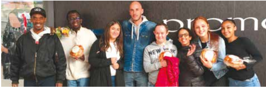
Les lycéens de Saint-Louis ont participé à la vente de brioches organisée par l'association La Chrysalide .

Ces actions ponctuelles ont permis aux participants de toucher du doigt des réalités peut-être jusqu'ici inconnues pour eux. Autant d'incitations à s'engager dans des actions à plus long terme, dans l'esprit de l'abbé Fouque.