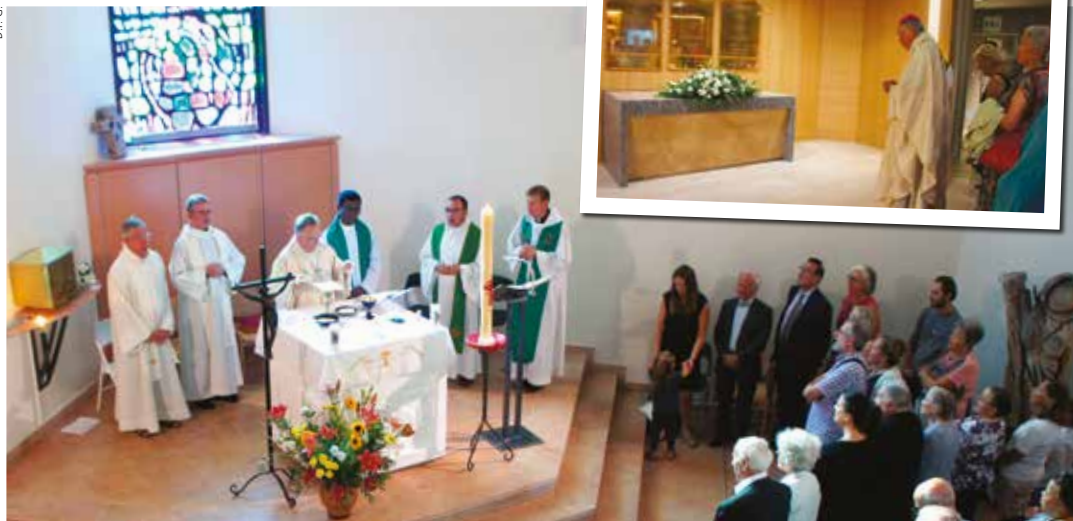
▲ 22 SEPTEMBRE. Bénédiction de la chapelle restaurée de l'Hôpital Saint Joseph.