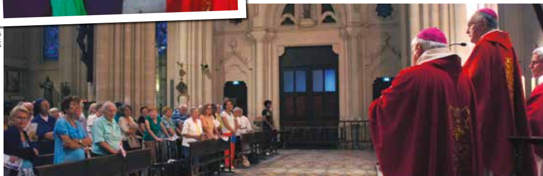
▲ 21 SEPTEMBRE. C'est à l'église Saint-Vincent-de-Paul – Les Réformés, le 21 septembre, jour anniversaire du baptême de Jean-Baptiste Fouque et dans l'église où il a été baptisé, que s'est ouverte la décade de préparation à sa béatification.