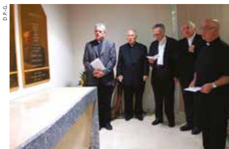
▲ 20 JUIN. Prière autour du tombeau à l'Hôpital Saint Joseph avant l'exhumation. De gauche à droite: P. Brunet, Mgr Ardura, Mgr Pontier, Mgr Aveline et Mgr Ellul.

C'est dans la cathédrale archiépiscopale – plus de 4 000 personnes – dont il fut vicaire entre 1885 et 1888, que l'abbé Jean-Baptiste Fouque a été déclaré bienheureux par le cardinal Giovanni Angelo Becciu, préfet de la Congrégation pour les causes des saints, au nom du pape François, le dimanche 30 septembre. Une célébration fervente, joyeuse, populaire, ponctuée d'applaudissements, précédée d'une semaine de manifestations dans les lieux où a vécu l'abbé Fouque et dans les œuvres qu'il a créées. Retour en images sur cet événement marseillais qui a fédéré par le biais de divers temps forts locaux et initiatives solidaires.