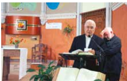
▲ 26 SEPTEMBRE. Mgr Ardura dans la chapelle de Timon-David où l'abbé Fouque a célébré sa première messe.