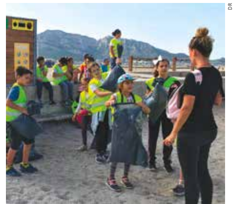
B.A. écocitoyenne pour les écoliers de Robert-Schuman qui ont participé au nettoyage des plages du Prado.

Dans un autre établissement, des élèves connaissaient une famille vivant dans la précarité : ils ont commencé à faire des colis alimentaires avec tout ce que les élèves de la classe apportent régulièrement pour venir en aide à cette famille. B.A. écocitoyenne pour les élèves de CMI et CM2 de l'école Robert-Schuman et leurs