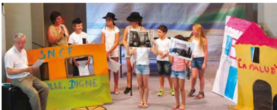
▲ 27 JUIN. À Auriol, une soirée a rassemblé les enfants de la catéchèse, les jeunes de l'aumônerie, les membres du catéchuménat, les bénévoles, ainsi que le Cercle Saint-Pierre et la Musique des Amis réunis. Au programme, un spectacle très réussi sur la vie et les œuvres de l'abbé Fouque, des témoignages et le repas paroissial de fin d'année.