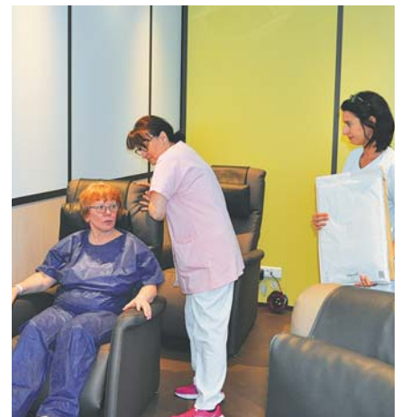
Une patiente dans un fauteuil du SAS avec oreiller sonore

La nouvelle organisation mise en place au RCG prouve que ce nouveau système fonctionne : le patient est mieux préparé à son hospitalisation, il a reçu toutes les informations en amont et pu avoir toutes les réponses à ses questions, il est