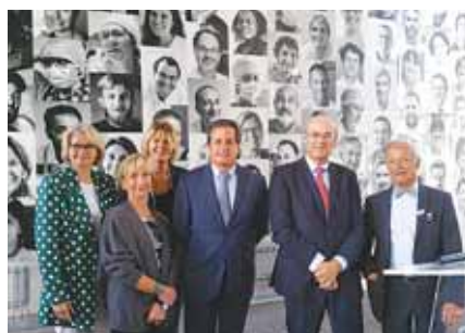
Lancement officiel des Journées