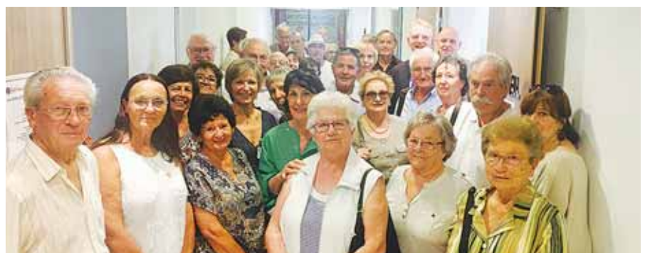
Quelques-uns des donateurs de la Fondation lors de l'inauguration organisée en leur honneur

un parcours de soins spécifique pour répondre au mieux à son trouble de la vue. L'organisation du nouveau service permet également un gain de temps, de fluidité dans le déroulement des examens et une meilleure coordination des rendez-vous et de la prise en charge d'urgences non programmés. ■