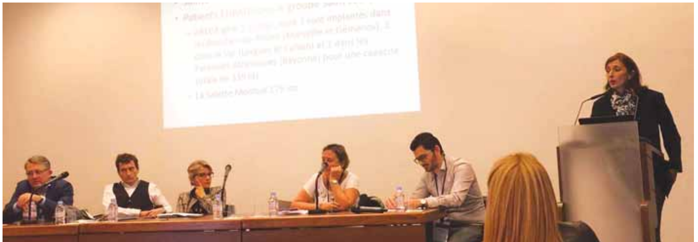
Atelier TELEMEDECINE - Salon INNOV'inMED des 26 et 27/10

LA DIRECTION DE L'HÔPITAL A REÇU IL Y A QUELQUES JOURS LA NOTIFICATION OFFICIELLE PAR L'ARS DE SON SOUTIEN FINANCIER À NOTRE PROJET DE TÉLÉDERMATOLOGIE DESTINÉ AUX PATIENTS RÉSIDANT EN EHPAD OU MAISON DE RETRAITE, PUIS ÉLARGI AUX PATIENTS PRIS EN CHARGE DANS DES ÉTABLISSEMENTS OU TERRITOIRES ISOLÉS. UN COUP DE POUCE PRÉCIEUX POUR DÉVELOPPER CE BEAU PROJET.