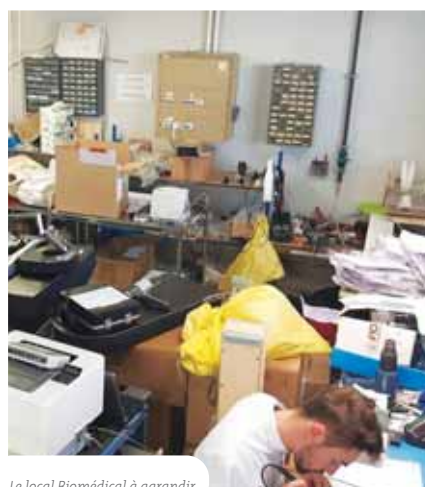
Le local Biomédical à agrandir

Les locaux du service Biomédical , qui gère tout le matériel médical de l'Établissement, vont quant à eux être agrandis. Situé au 3 ème étage du bâtiment de Vernejoul, le service va s'étendre sur une terrasse située à proximité.