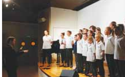
Les Petits Chanteurs de la Major

Deux belles journées remplies de jolis moments d'échanges et de partages.