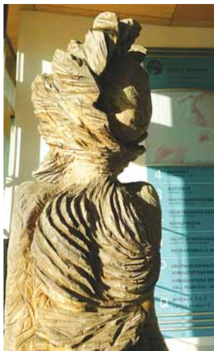
Sculpture végétale de Marc Nucera