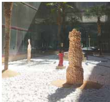
Sculptures de Célia Cassai de l'ESAD