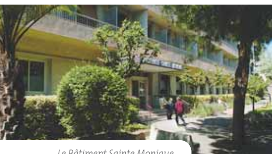
Le Bâtiment Sainte Monique

Cette création répond au double objectif de favoriser une mutualisation des compétences maladies chronique et des associées à une maladie ; et de libération de lits d'hospitalisation complète dans les services.