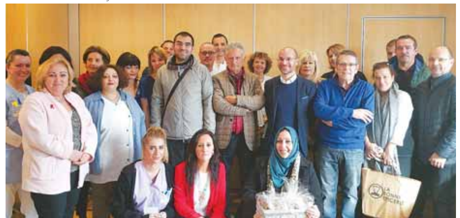
Les gagnants en présence des partenaires et de la Direction de l'Hôpital.