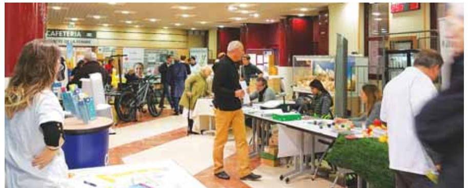
Les nombreux stands d'information.

La remise des prix a eu lieu le jeudi 14 décembre dernier, un Noël un peu avant l'heure pour les heureux gagnants ! ■