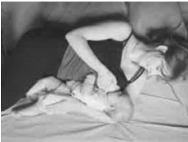
La position allongée

> Cette position est bien adaptée pour les premiers jours. Elle vous permet de bien guider la tête de votre bébé et de soutenir sa nuque d'une main ; l'autre main peut soutenir le sein si nécessaire.