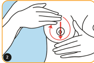
Avec les mains à plat, avancez progressivement de l'extérieur vers l'aréole, jusqu'au mamelon. Répétez l'opération tout autour de la circonférence des seins.