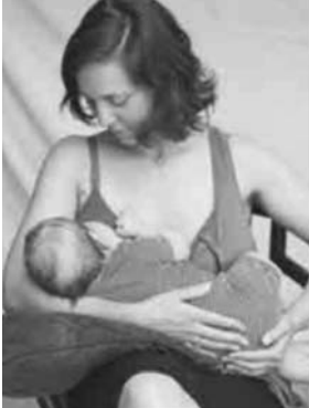
La position de la berceuse (ou « de la Madone »)

Normalement, allaiter ne doit pas faire mal, mais cela peut cependant arriver. Le plus souvent, c'est lié à une mauvaise position d'allaitement qui fait que le bébé ne prend pas bien le sein, et c'est pour cela qu'il faut veiller à bien vous positionner et à bien positionner votre enfant. Plus rarement, d'autres facteurs peuvent être à l'origine d'une douleur ou d'une lésion des mamelons : les professionnels qui vous accompagnent les premiers jours vous aideront à les identifier et vous donneront les conseils adaptés en cas de besoin.