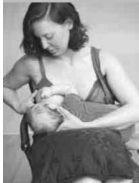
La berceuse modifiée (ou « Madone inversée »)

Vous pouvez aussi choisir une autre position. Adoptez celle qui vous convient le mieux. L'essentiel est votre confort et celui de votre enfant.