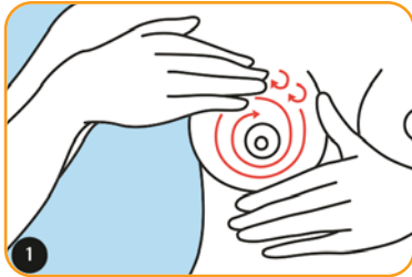
Massage aréolaire : avec trois ou quatre doigts, effectuez des mouvements circulaires de l'extérieur du sein vers l'aréole.

Le massage aréolaire (dessins 1 et 2) peut être utilisé pour désengorger les seins tendus (voir aussi l'engorgement, page 18). Vous pouvez effectuer ce massage en préalable de l'expression manuelle du lait (dessins 3 et 4).