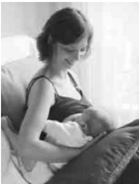
La position « ballon de rugby »

> Allongée sur le côté, un coussin entre les jambes et dans le dos, vous avez la jambe supérieure repliée pour ne pas basculer en avant. Votre bébé est allongé en face de vous, loin du bord du lit, sa bouche au niveau du mamelon. S'il n'est pas tout à fait à la bonne hauteur, placez sous lui une serviette repliée pour le mettre bien au niveau du sein.